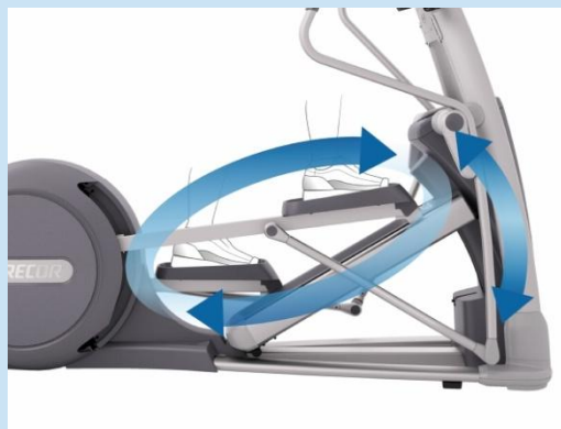
クロスランプ技術